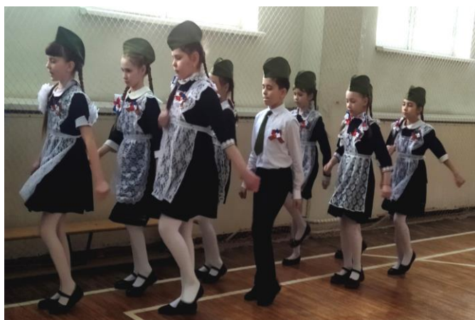
Команда – победительница на марше