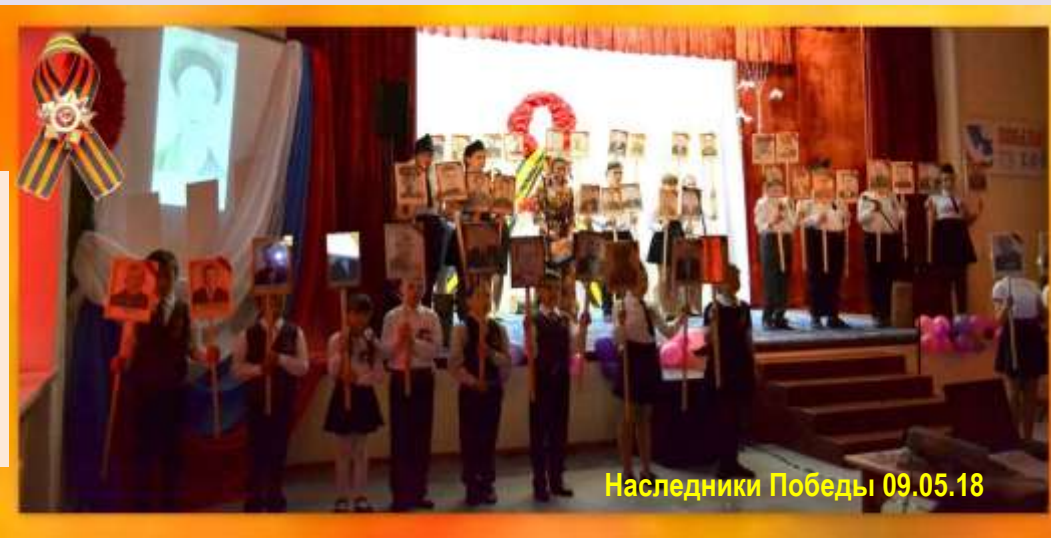
Наследники Победы 09.05.18

пережила бабушка. Слушая её, я испытываю замешательство и чувствую страх. Особенно, когда понимаю, что многим в это время приходилось в разы тяжелее.