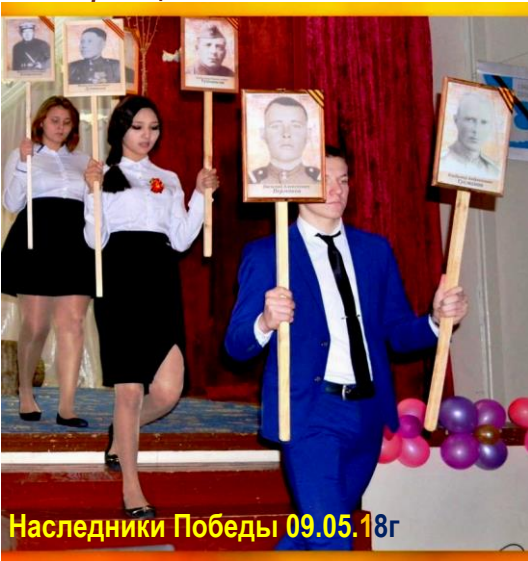
Наследники Победы 09.05.18г

«В этом году, к огромному сожалению, в связи с пандемией и режимом самоизоляции День Победы не может быть проведен так, как обычно: с торжественной музыкой на всю улицу, цветами и громкими словами, доносящимися до каждого из присутствующих на митинге. Но даже такая сложная ситуация не сможет позволить народу изменить традиции.