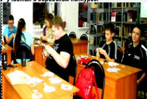
7 и 8 классы за работой

всегда украшали школу к любимому празднику. Но этой зимой мы украшали не только ради атмосферы праздника, но и для участия в городском конкурсе.