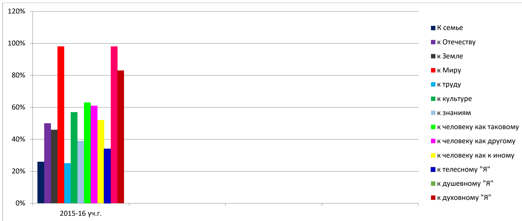
Рис.1 Уровень личностного роста 2015- 2016 уч. год.