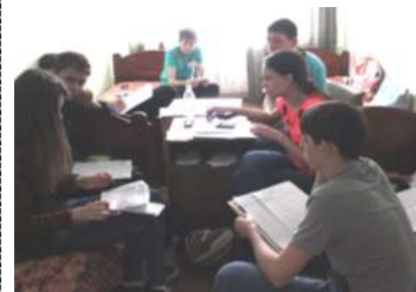
Мозговой экономический штурм «Новой цивилизации»

Жаль, что кто-то не захотел участвовать в этой познавательной молодёжной игре!» П. Севостьянова